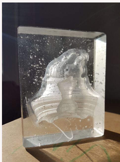
Vue finale du projet Multiverre