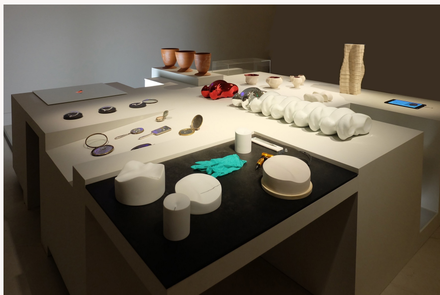
Vue de la table d'exposition de l'ENSA Limoges. © Michel Paysant