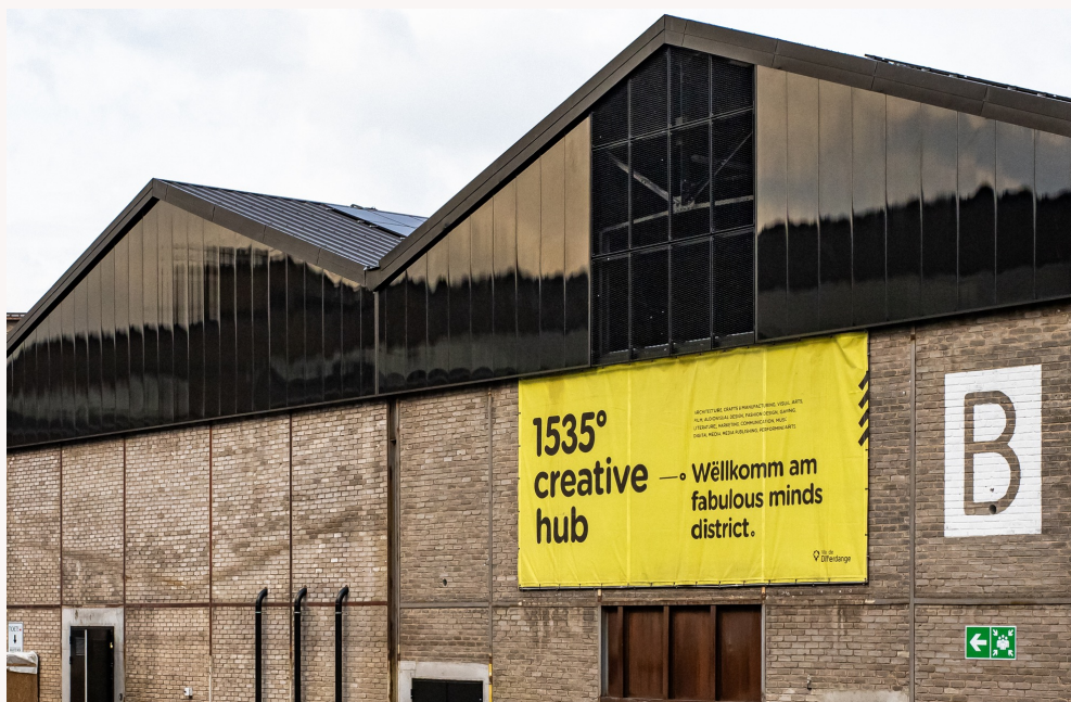
Vue extérieure du bâtiment B @1535 – creative hub

D'une surface d'exploitation totale de 1240 m 2 , le Bâtiment B offre six espaces de création de type « store » et 445 m 2 d'espace polyvalent, le « Hangar », dédiés principalement aux répétitions des arts du spectacle et à des expositions.