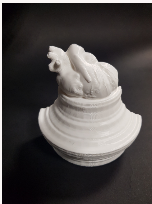
Modèle 3D du projet Multiverre