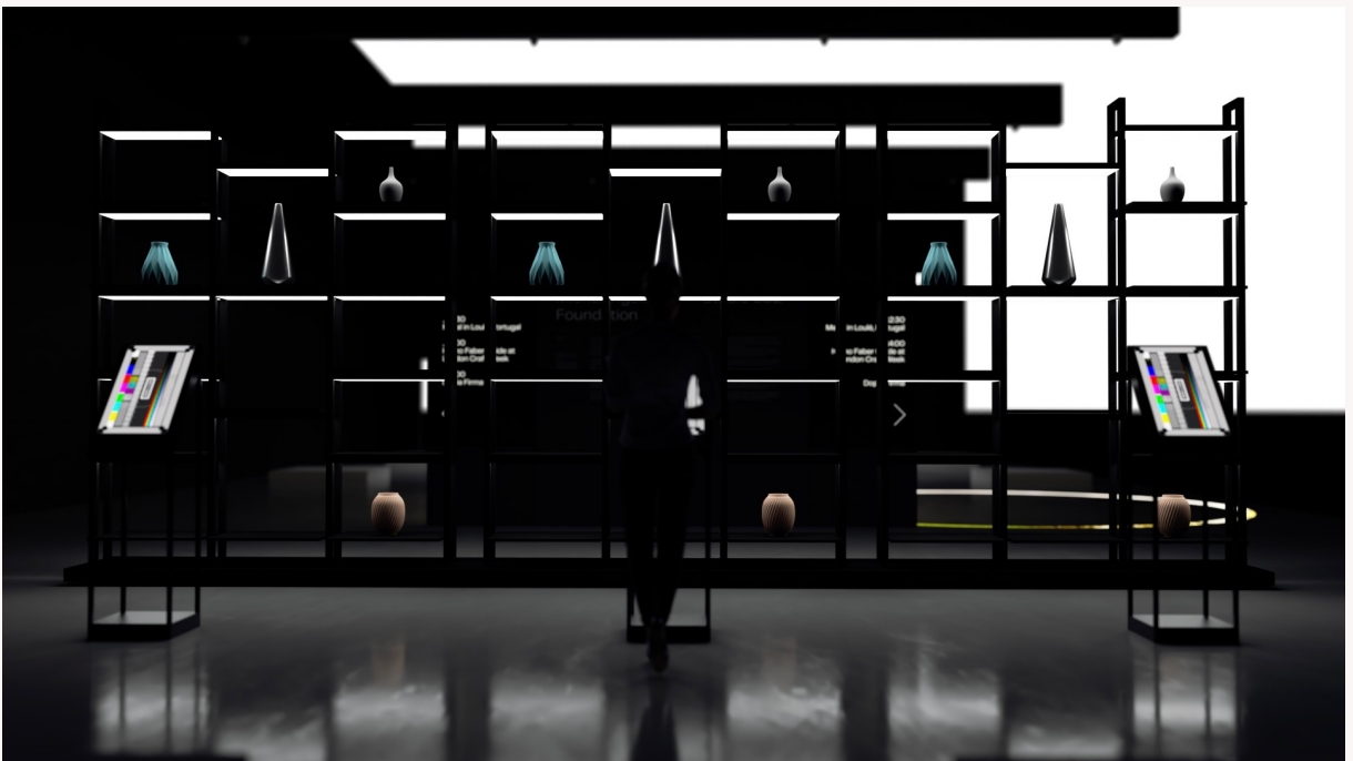
Vue de l'objeothèque.